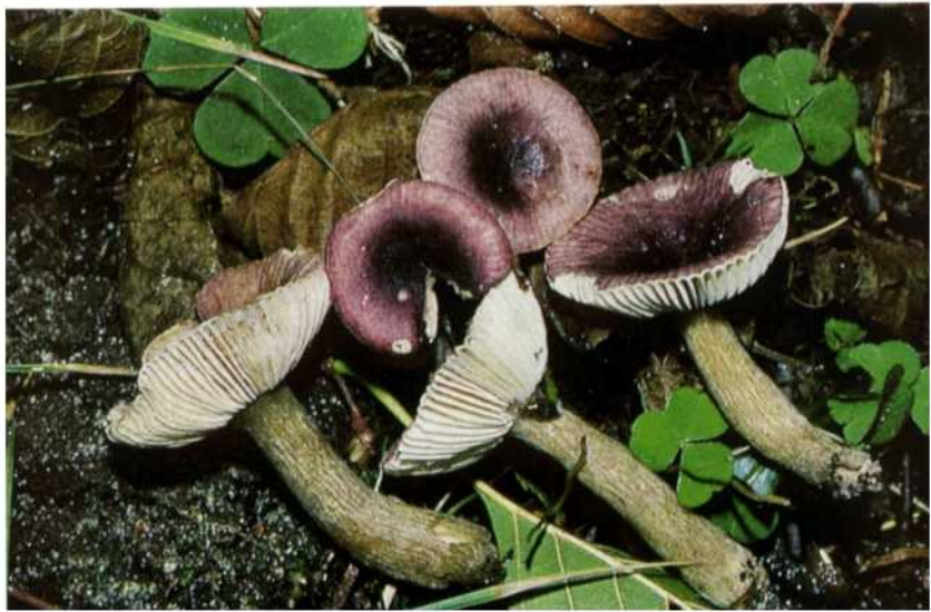
Abb. 1. Russula pumila Rouzeau & Massart. – Westfalen, Stukenbrock b. Bielefeld, in Carici-elongatae-Alnetum medioeuropaeum , 8. X. 1975. Oben: jüngere Pilze; unten: vollreife Pilze mit ockergrauen Stielen. Leg. B. Jorek et H. Jahn.