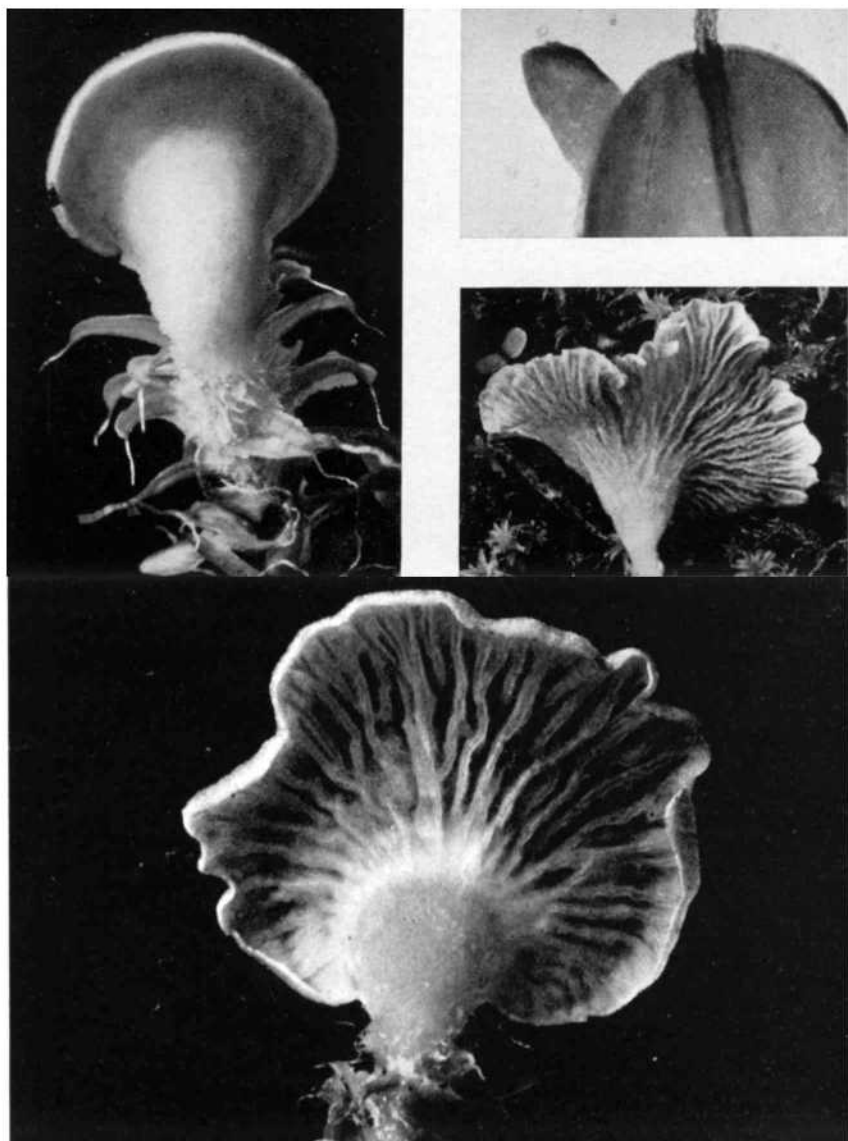
Entwicklungsstadien von Leptoglossum muscigenum Abb. 1 (links oben) 10 x, Abb. 2 (rechts oben) 35 x, Abb. 3 (rechts mitte) 2 x, Abb. 4 (unten) 6 x vergrößert