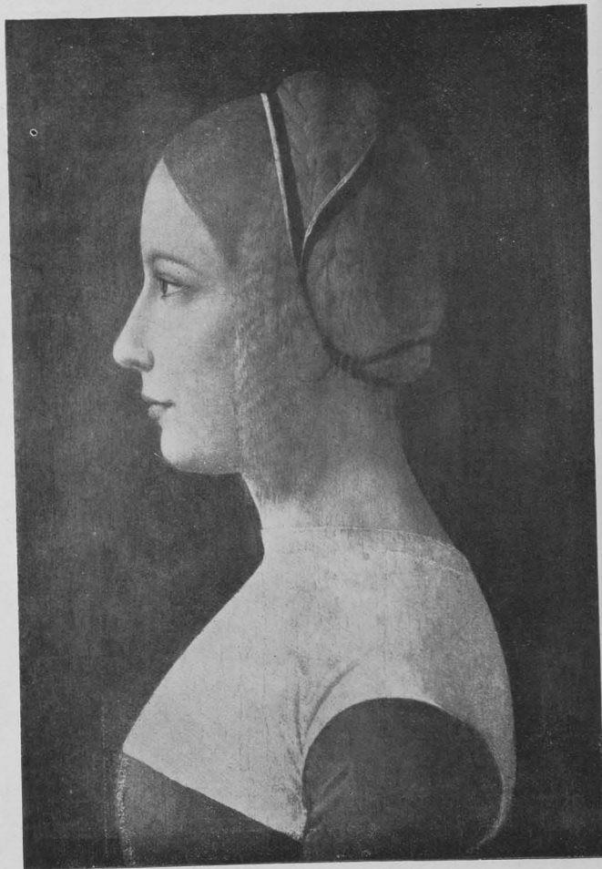
Ambrogio de Predis