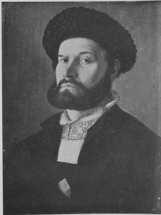
Hans von Kulmbach