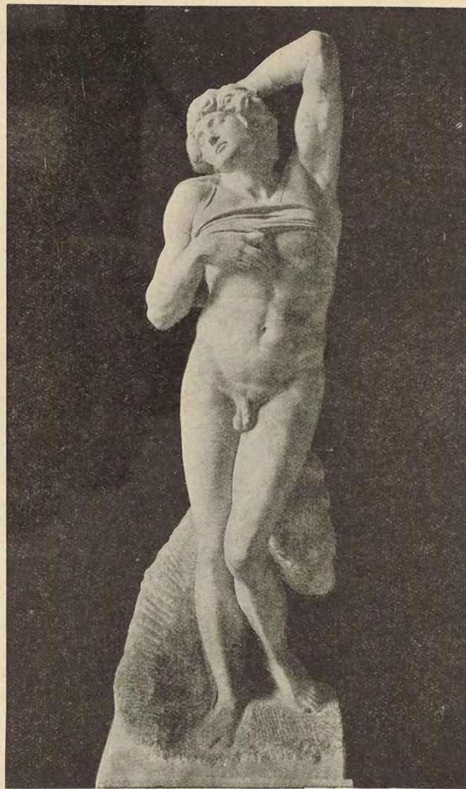
MICHEL-ANGE. Premier esclave du Tombeau de Jules II.