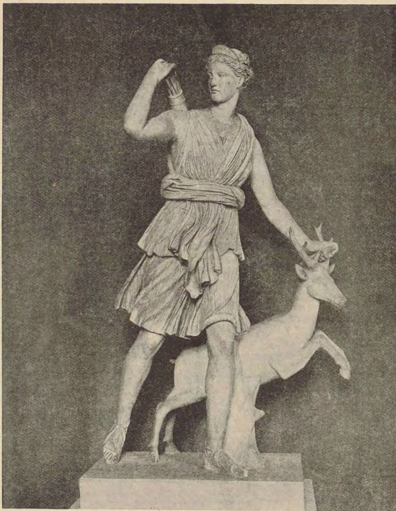
Diane chasseresse dite « Diane à la biche ».